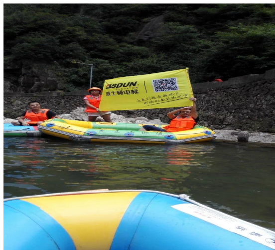
图 8 员工关怀活动